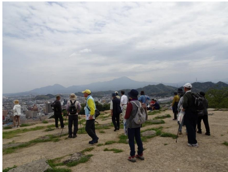
米子城山から大山を望む

フェスティバルでは朝の米子城山で太極拳、大山さん遥拝、いま話題の登り石垣見学、下山して城下町歩き、お地蔵さんめぐり、加茂川音頭踊り体験、米子美術館で開催中のシニア作品展鑑賞・・・と続きます。シニアバンク登録のみなさんが、参加のみなさまをおもてなしいたします。