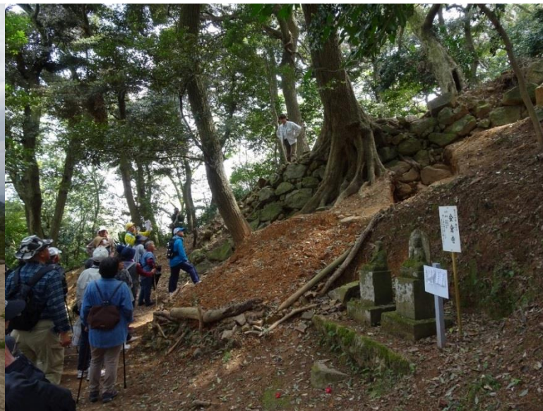
全国初の発掘調査が進む米子城の登り石垣