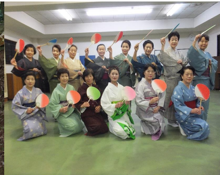
加茂川音頭踊りのみなさん